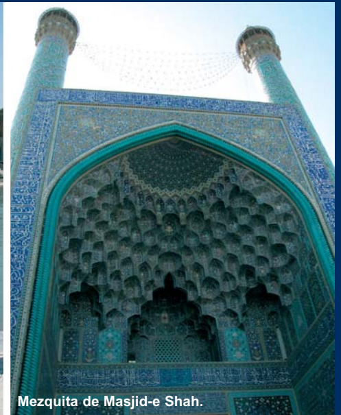
Mezquita de Masjid-e Shah.