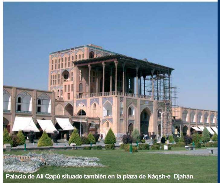
Palacio de Alí Qapú situado también en la plaza de Náqsh-e Djahán.