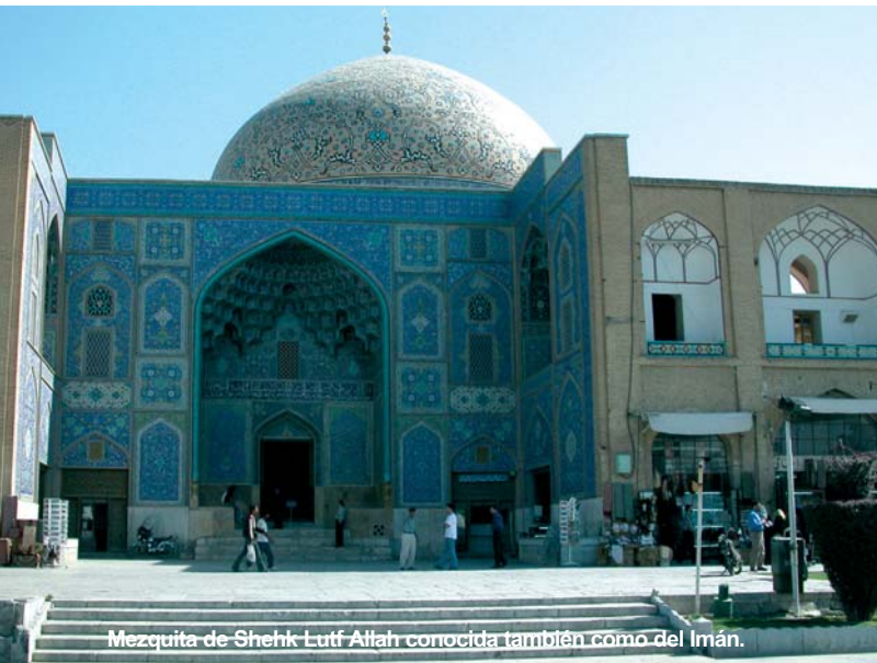
Mezquita de Shehik Lutf Allah conocida también como del Imán.