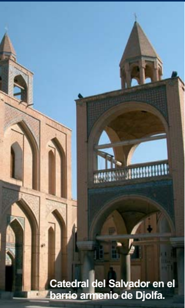
Catedral del Salvador en el barrio armenio de Djolfa.