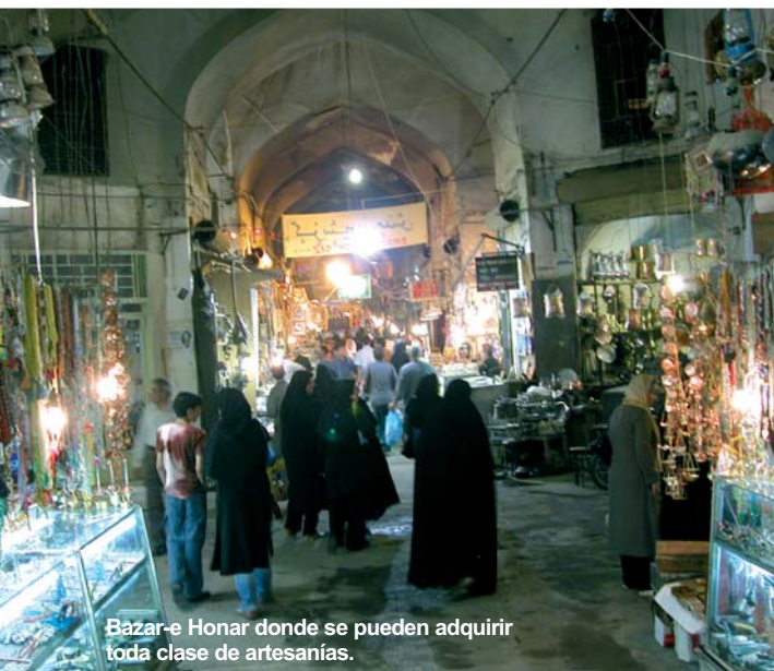
Bazar-e Honar donde se pueden adquirir toda clase de artesanías.