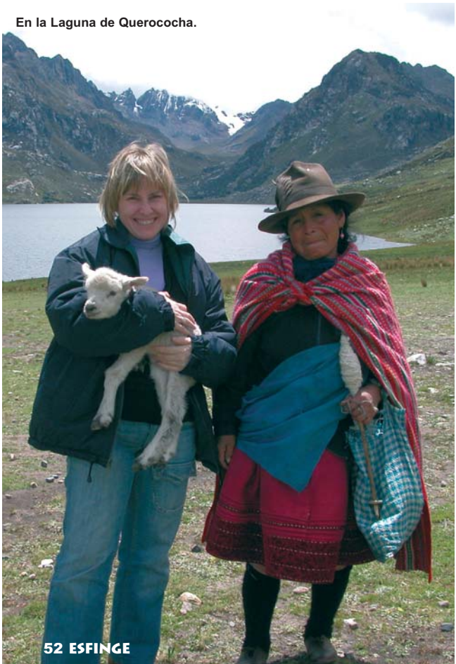
En la Laguna de Querococha.