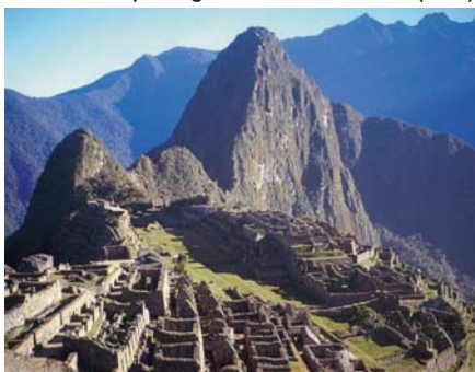
Ruinas arqueológicas de Machu Picchu (Perú)

Desierto de Atacama, Altiplano Andino, Cordillera Andina.