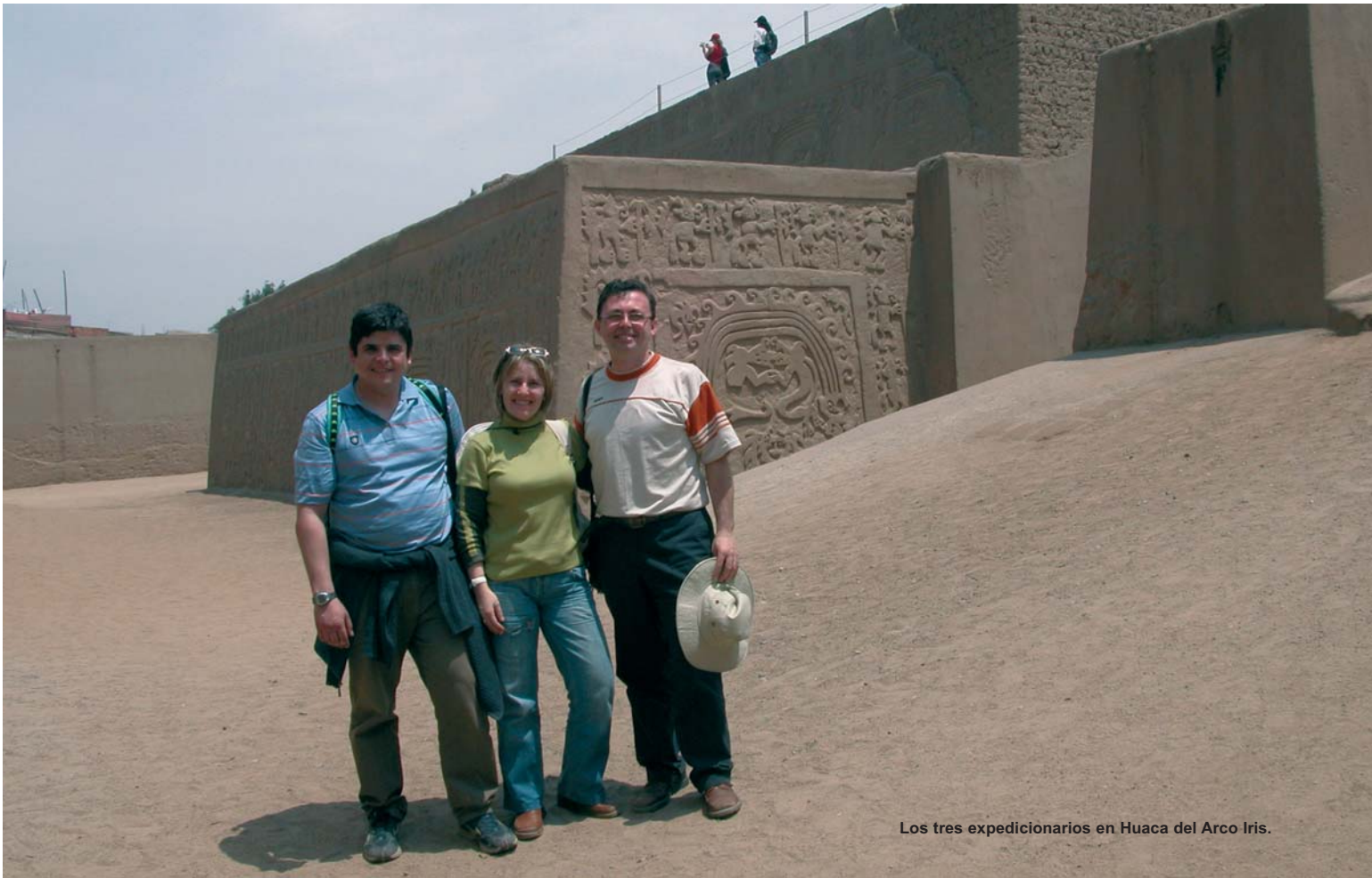
Los tres expedicionarios en Huaca del Arco Iris.