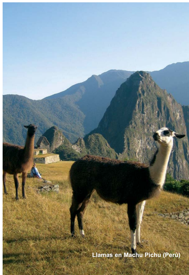
Llamas en Machu Pichu (Perú)