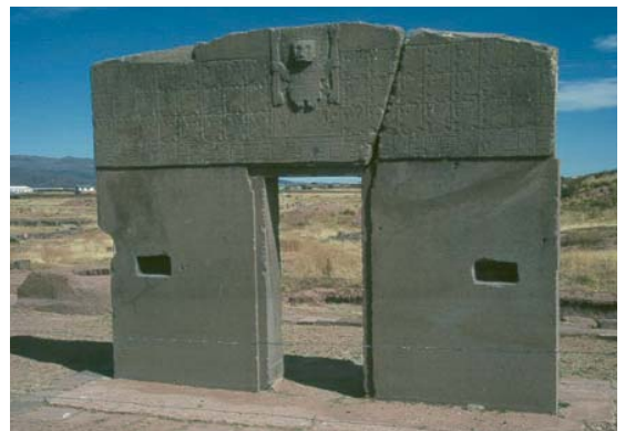
Puerta del Sol, Tiahuanacu (Bolivia)

En el próximo número de Esfinge podréis ver las primeras fotografías de la expedición, que esperamos os gusten. Tenednos presentes y no dejéis de venir a visitarnos. Aunque las distancias parezcan enormes, la tecnología nos acerca unos a otros. Recordad, os estamos esperando en www.estudiosgeograficos.org . ✪