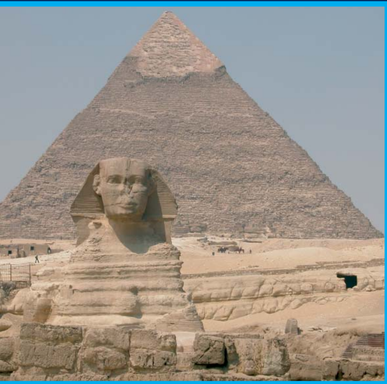
Giza frente a la Pirámide de Kefrén, a las afueras del Cairo