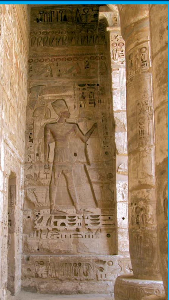
Framentos del Templo funerario de Ramsés III, en Medineth Habu