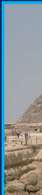
La Esfinge de Giza