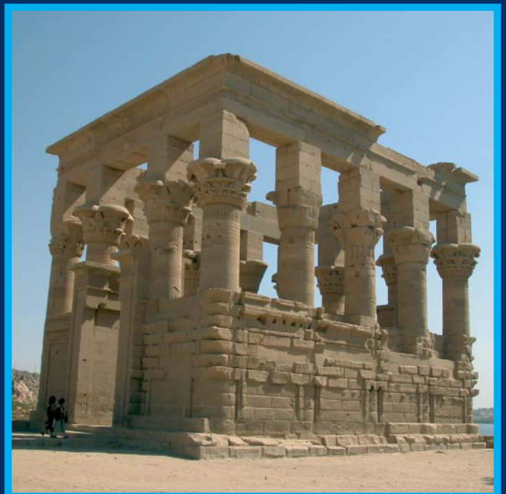
Kiosco de Trajano, junto al Templo de Isis en la isla de Filae