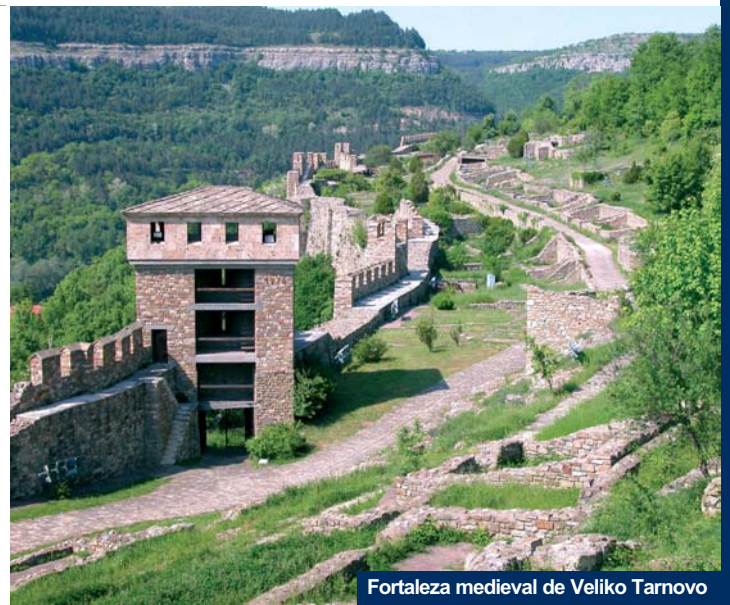
Fortaleza medieval de Veliko Tarnovo