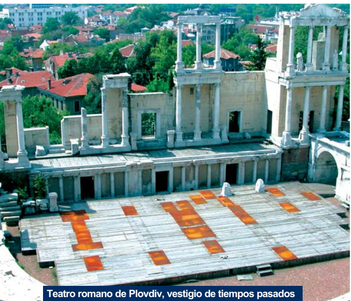
Teatro romano de Plovdiv, vestigio de tiempos pasados