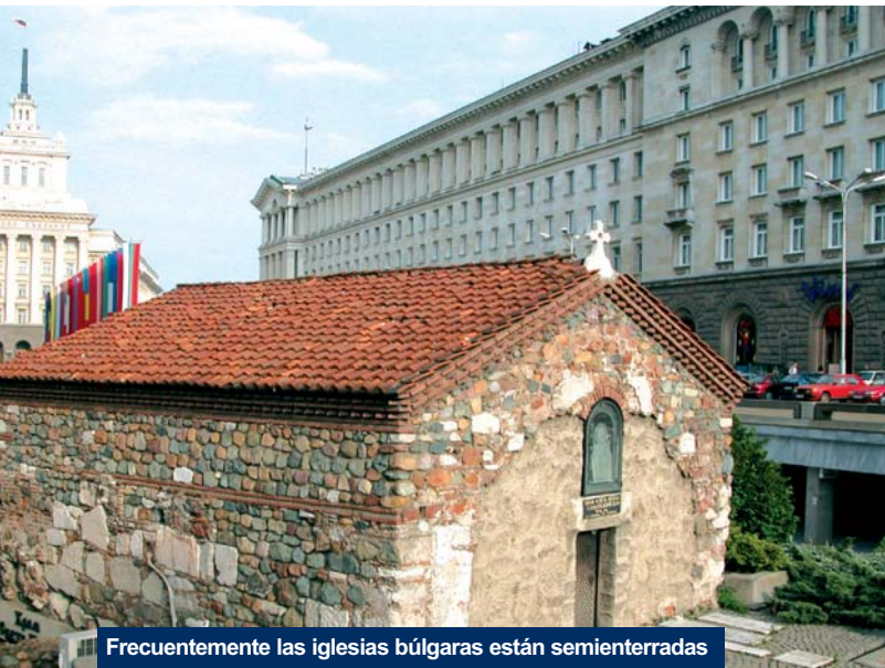
Frecuentemente las iglesias búlgaras están semienterradas