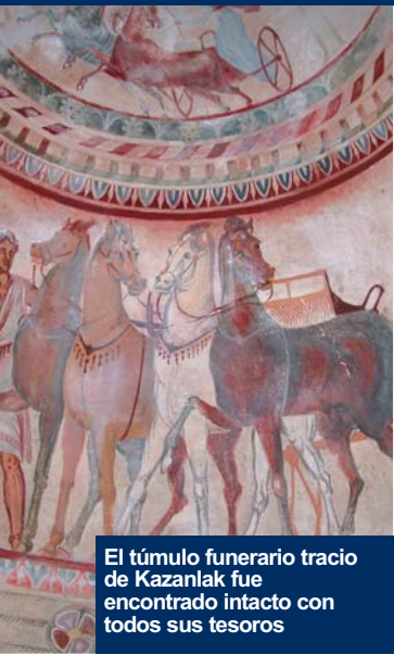
El túmulo funerario tracio de Kazanlak fue encontrado intacto con todos sus tesoros