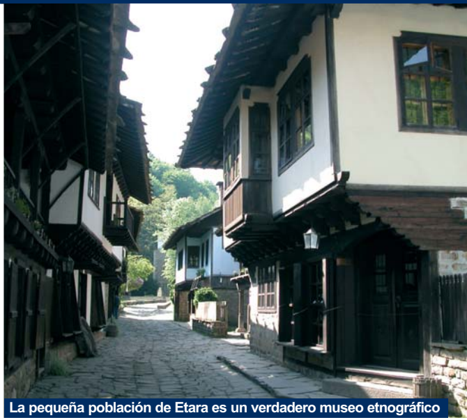
La pequeña población de Etara es un verdadero museo etnográfico